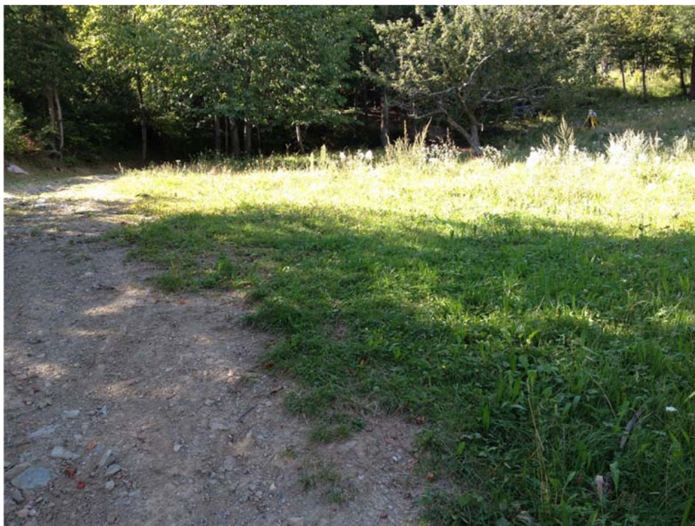
Foto n. 5 – Vista situazione terreno a valle nel tratto centrale del tracciolino esistente