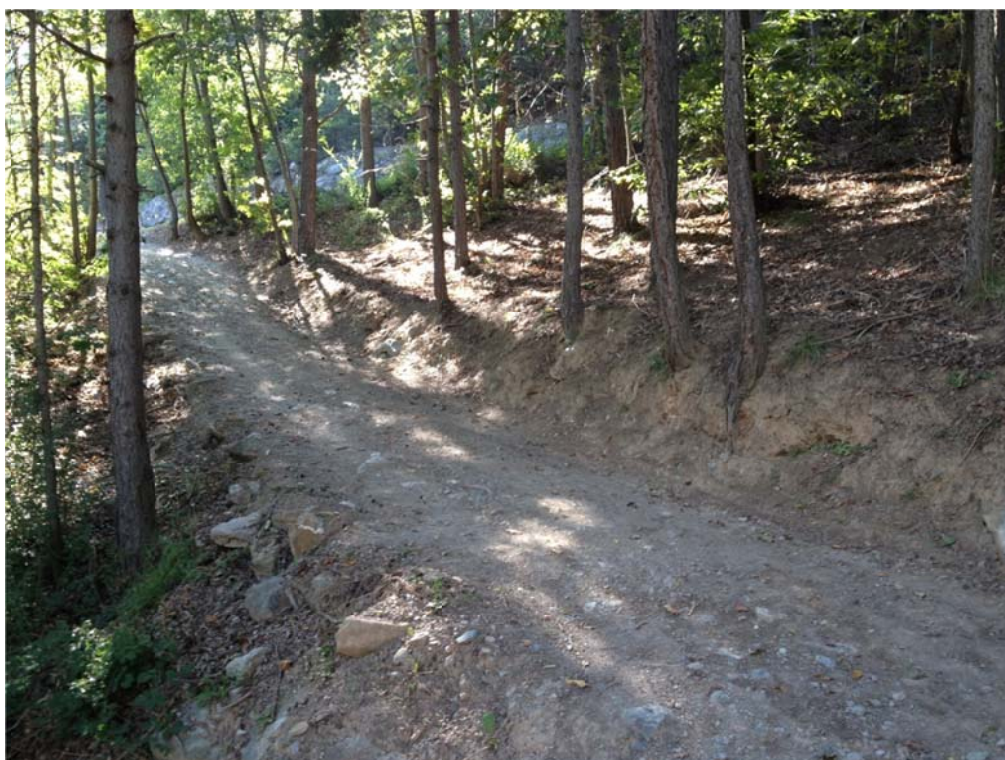
Foto n. 4 – Vista tracciolino esistente in corrispondenza del tornante