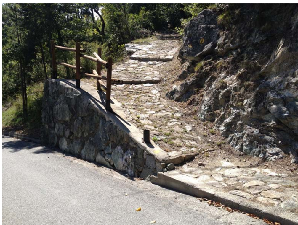
Foto n. 2 – Vista particolare sentiero esistente in selciato con staccionata in legno