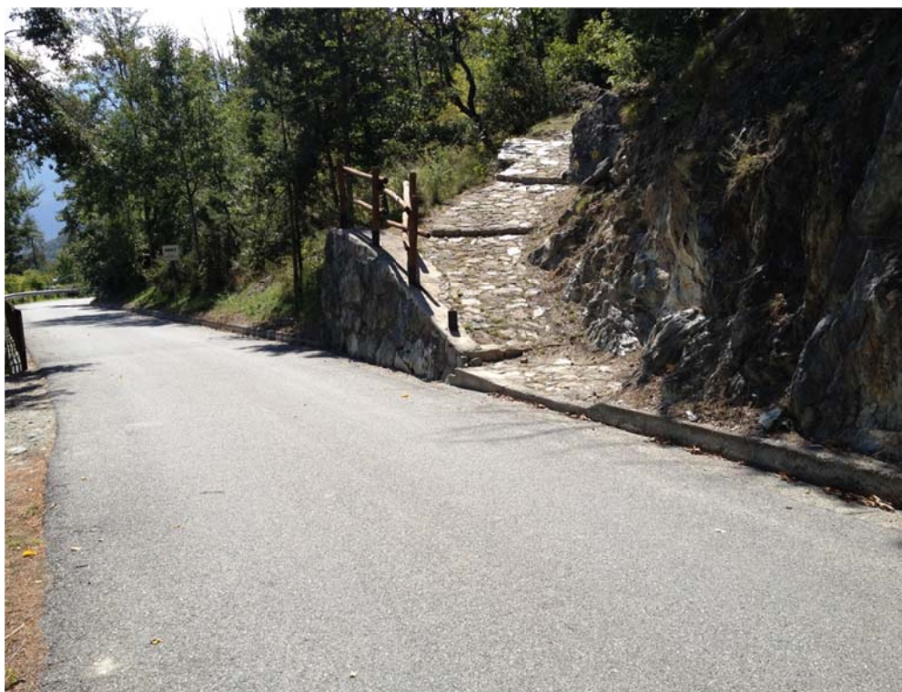
Foto n. 1 – Vista imbocco strada esistente sulla destra e sentiero in selciato sulla sinistra