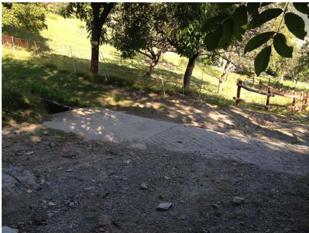
Foto n. 9 – Vista ponticello esistente realizzato con lastre in c.a.